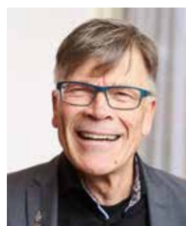
Fokko Oldenhuis is universitair hoofd-docent vermogensrecht en bijzondere hoogleraar Religie en Recht aan de Rijksuniversiteit Groningen